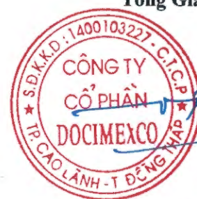
TRẦN HỮU HIỆP